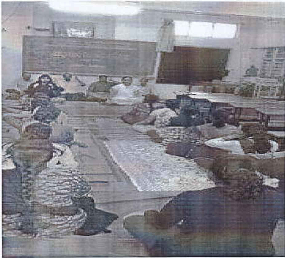
TEACHERS AND STUDENTS PRACTICING YOGA